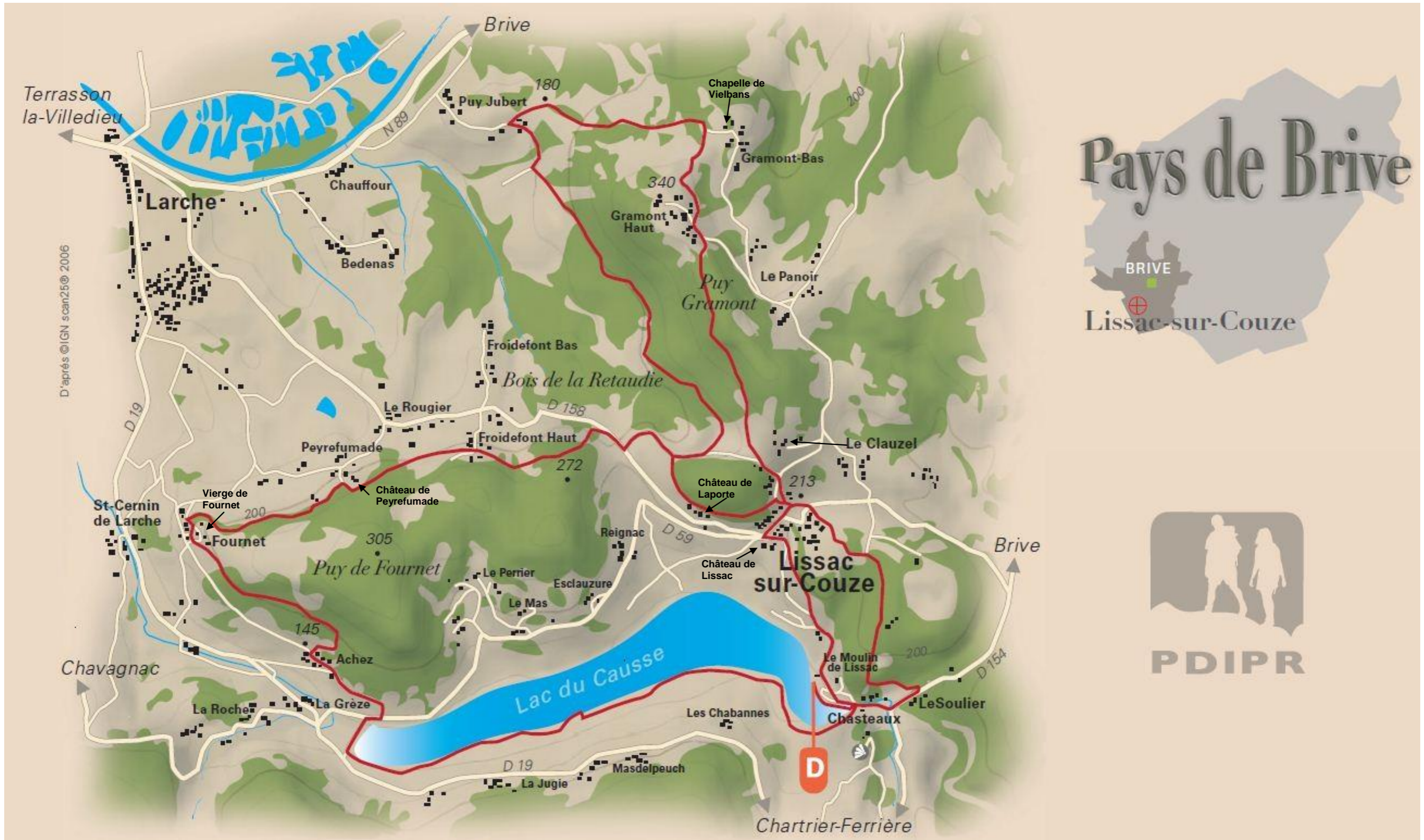
Conception de la carte pour le Conseil Général de la Corrèze : de 2 choses LUNE